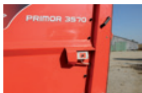
Duální ovládání zadního čela

Volitelná výbava se liší v různých zemích ■ Standardní výbava - Nelze