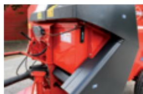
45 l/min -1 hydraulický pohon