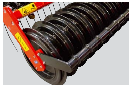
VÁLEC T-LINER Ø 600 - 140 kg/m