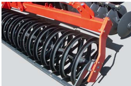
VÁLEC T-RING Ø 600 - 130 kg/m