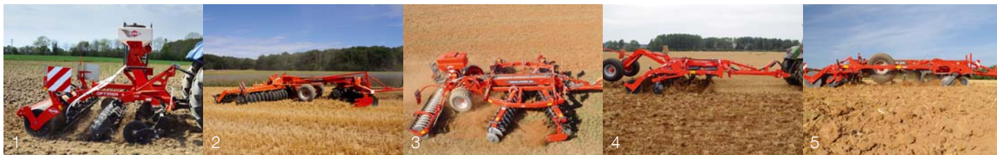
1. OPTIMER+ 2. DISCOVER 3. DISCOLANDER 4. CULTIMER L 5. PERFORMER

Svého nejbližšího prodejce KUHN naleznete na www.kuhncenter.cz