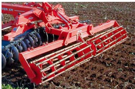
TRUBKOVÝ VÁLEC Ø 550 - 75 kg/m

Válec (na přání) může být vybaven mechanickým odpružením (řady XM2). V transportní poloze válce nepřesahují rozměry stroje.