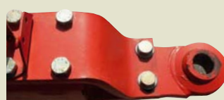
RŮZNÁ PROVEDENÍ OJÍ