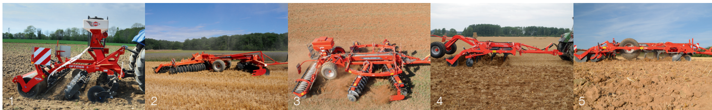
1. OPTIMER+ 2. DISCOVER 3. DISCOLANDER 4. CULTIMER L 5. PERFORMER

Svého nejbližšího prodejce KUHN naleznete na www.kuhncenter.cz